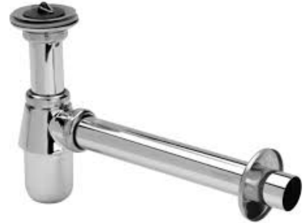
Viega Plugbekersifon met muurbuis en rozet, chrom