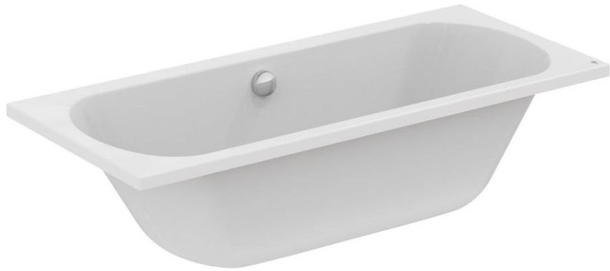
Ideal Standard Duobad ligbad 180 x 180

De bouwnummers 31 en 38 worden voorzien van een bad in de badkamer