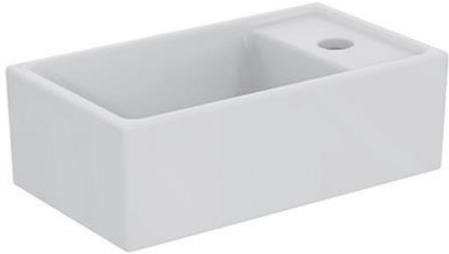
Ideal Standard Fontein 37cm x 21 cm met kraangat rechts, wit