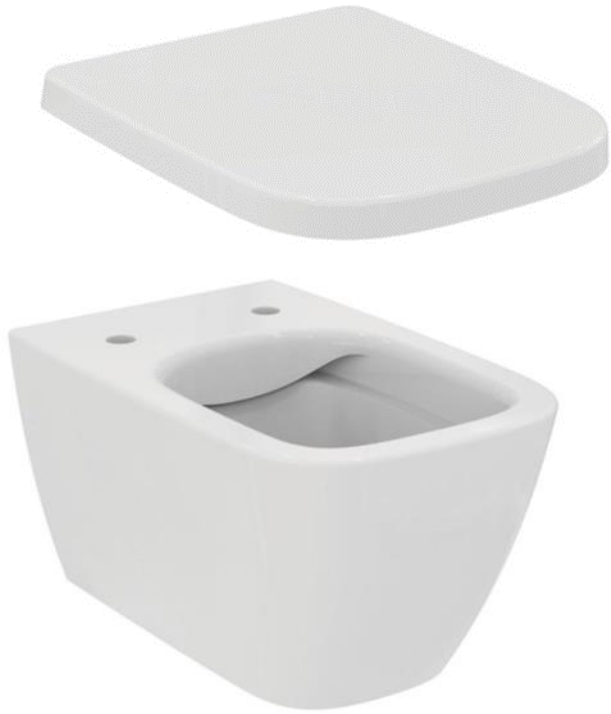
Ideal Standard Wandcloset, i.life rimless met wrapover zitting en deksel, kleur wit