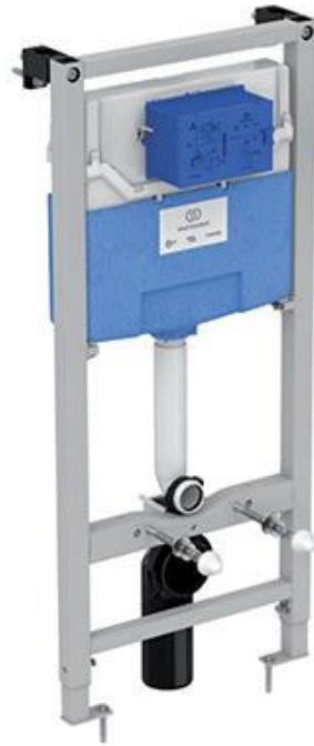
Ideal Standard Inbouwreservoir