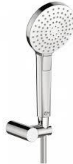
Ideal Standard Handdouche rond met 3 functies en doucheslang