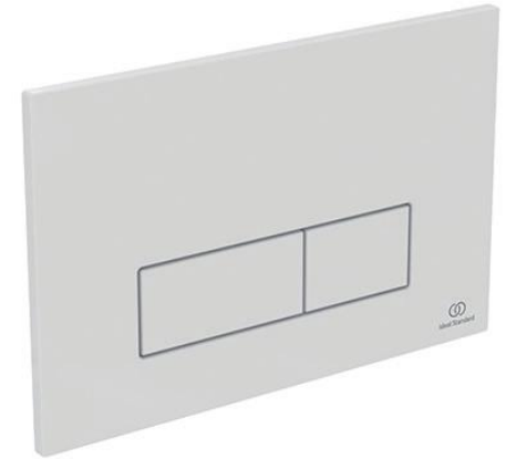
Ideal Standard Bedieningspaneel Oleas M2 wit