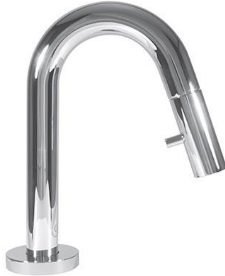
Ideal Standard Koudwaterkraan 6 l/min met hoge uitloop en geïntegreerde bediening in chrom