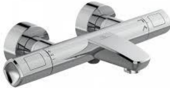
Ideal Standard Bad/douche thermostaat Cool Body in chroom